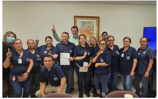
Limpeza comercial, Chicago