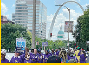
St. Louis, Missouri