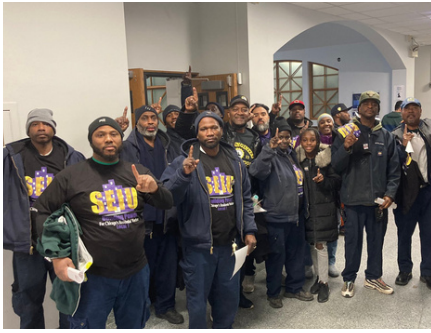
Limpeza residencial, Chicago