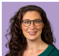
Gobernadora de Michigan Gretchen Whitmer

“Las Uniones apoyan a sus miembros para mejorar las condiciones y la remuneración de los trabajadores y sus familias. Las Uniones conectan a sus miembros con una red de apoyo que se extiende a todos los sectores, reforzando la posición de todos los miembros de la Unión cuando estos defienden sus intereses.”